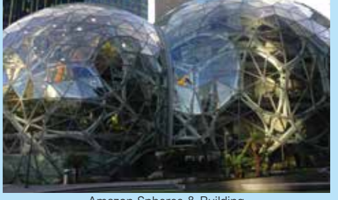
Amazon Spheres & Building