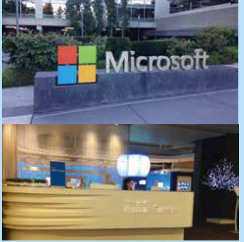
Microsoft Visitor Center

このプログラムの特徴としてシアトルに本社のあるMicrosoftとAmazonでのキャリア研修を予定しています。Microsoft Visitor Center TourではMicrosoftの企業経歴の展示や最新の技術を活かした体験型の施設を訪問いたします。Amazon、MicrosoftのCareer Eventでは、両社の社員による会社・業務内容の説明、企業見学、懇談会をします。アメリカの流通業界、IT業界で実際に働く人から話を聞くことで知識や理解を深め、自身のキャリアを考えるきっかけとなったり、日本へ帰ってからの活動の指針を定める糧になります。